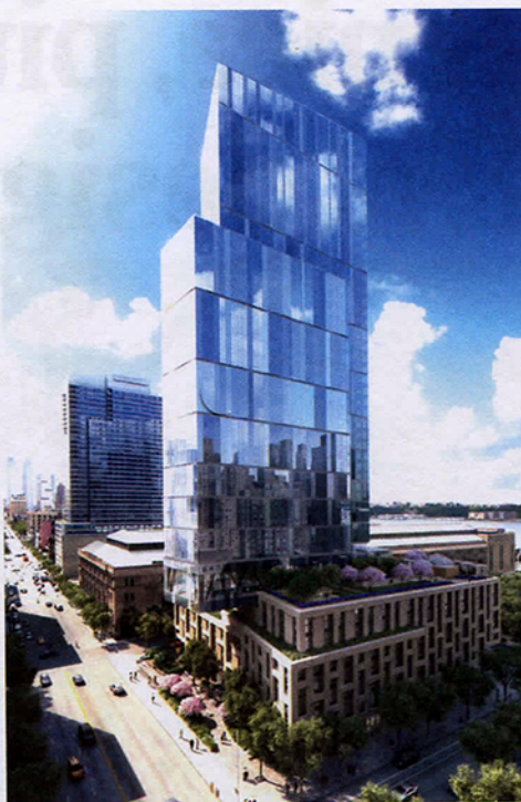
Le forniture di Scavolini per la torre One West End di Manhattan (progetto a cura dello studio Pelli Clarke Pelli Architects), con 250 cucine personalizzate da Jeffrey Beers

Tutta internamente, così come avviene per le cucine. Abbiamo due stabilimenti contigui, con unico ingresso, dove operano 550 dipendenti, a cui si aggiungono i 100 addetti di Ernestomeda, l'altra azienda del gruppo. Avete scelto Carlo Cracco come testimonial delle vostre cucine: un primo bilancio? Più che positivo! La prima parte della campagna adv ha registrato un ottimo